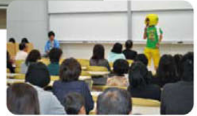
「あるある」、「そうなんだ」という声もあがり、メモをとる姿も…